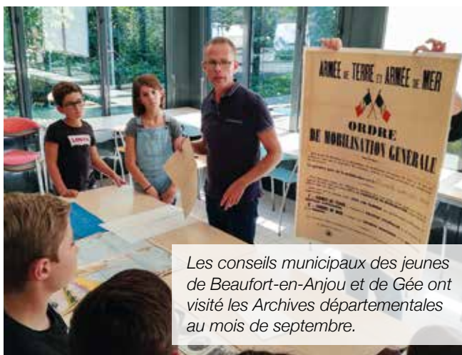
Les conseils municipaux des jeunes de Beaufort-en-Anjou et de Gée ont visité les Archives départementales au mois de septembre.

Aujourd'hui, si la situation se dégradait, comme en Syrie par exemple, une guerre serait possible. Elle serait encore plus meurtrière, avec le nucléaire. Mais est-ce qu'on nous obligerait à partir ?