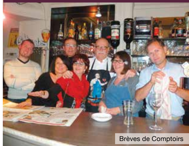
Brèves de Comptoirs