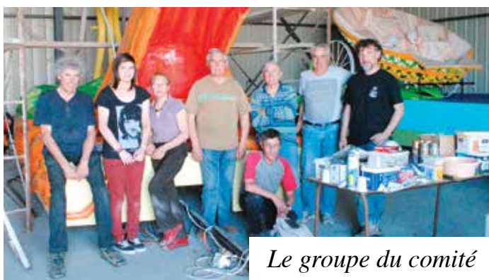
Le groupe du comité des fêtes au travail

A 16h : Concert - salle des Plantagenêts concert de l'orchestre d'harmonie de Beaufort.