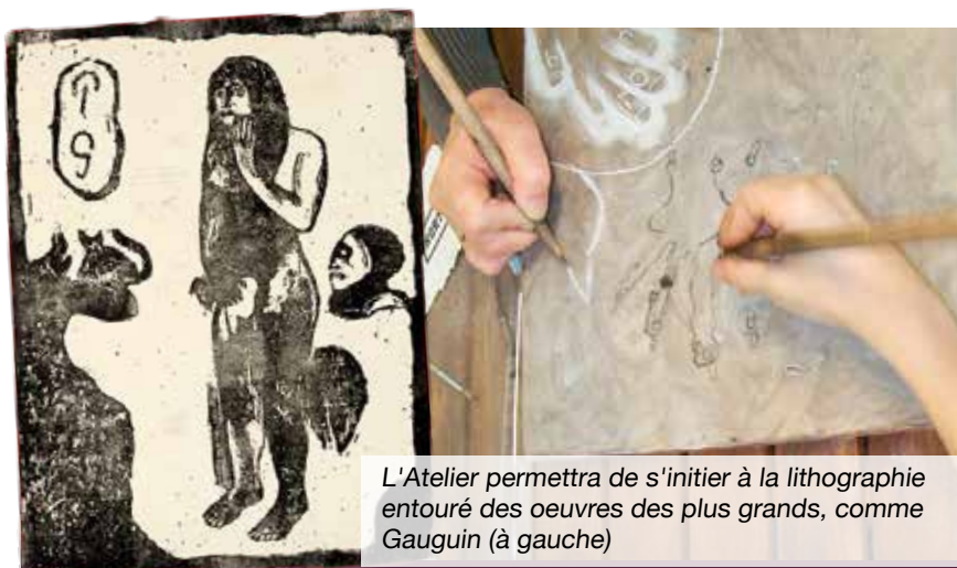
L'Atelier permettra de s'initier à la lithographie entouré des œuvres des plus grands, comme Gauguin (à gauche)