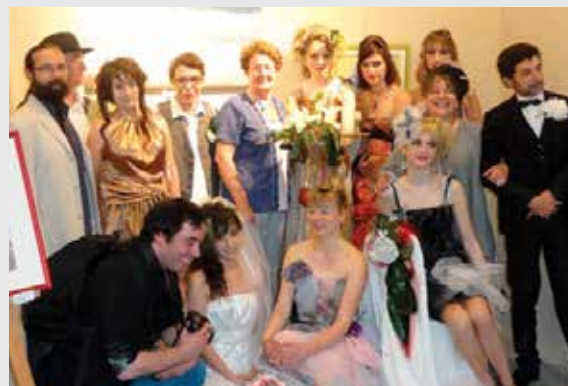
L'Atelier du Rempart : les participants à l'exposition des oeuvres des élèves en juin