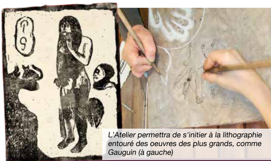
L'Atelier permettra de s'initier à la lithographie entouré des œuvres des plus grands, comme Gauguin (à gauche)