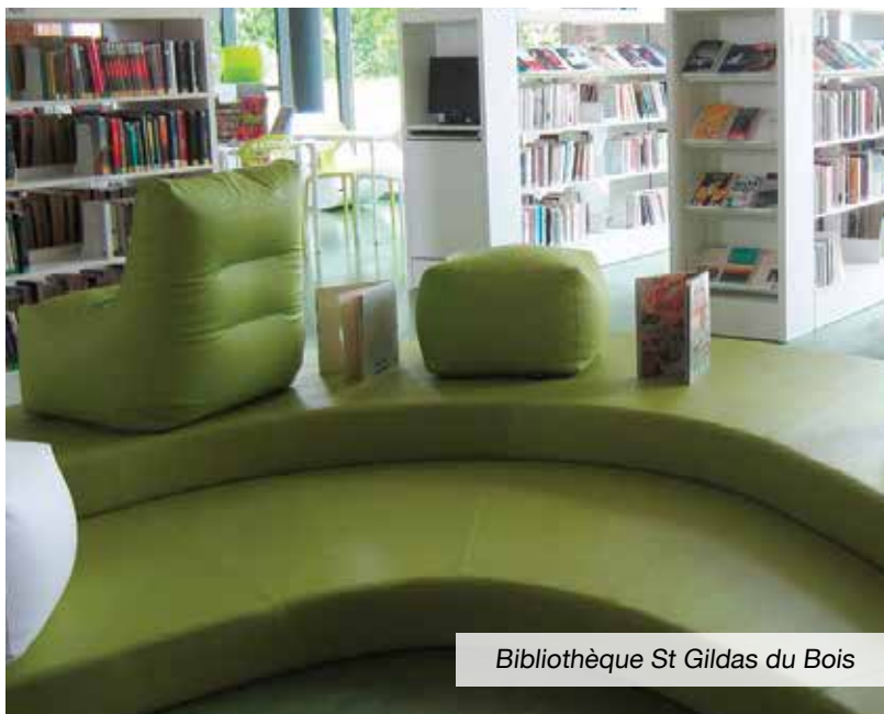
Bibliothèque St Gildas du Bois

La future bibliothèque de Beaufort-en-Vallée sera conçue par le cabinet d'architecture l'Atelier du lieu, retenu parmi 32 candidatures.