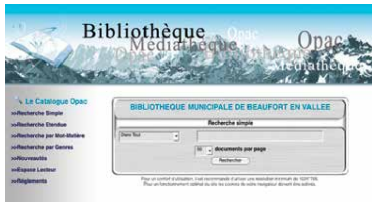
Page d'accueil du catalogue en ligne

Le catalogue de la bibliothèque est mis en ligne sur le site Internet de la ville.