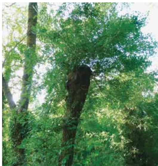
Le frêne têtard fournit de nombreux abris pour la faune des haies

La ville va réaménager une zone naturelle route de la Ménitré, au lieu-dit « Canada ». Il s'agit de retrouver un paysage de bocage. Certains peupliers, abîmés par les tempêtes seront arrachés pour être remplacés par des haies de frênes têtards. Ces arbres coupés régulièrement en « tête » produisent du bois de chauffage et fournissent de nombreux abris pour la biodiversité présente dans ces haies. Entre les haies et la prairie humide, un équilibre vivant renaîtra, respecté par le fauchage tardif.