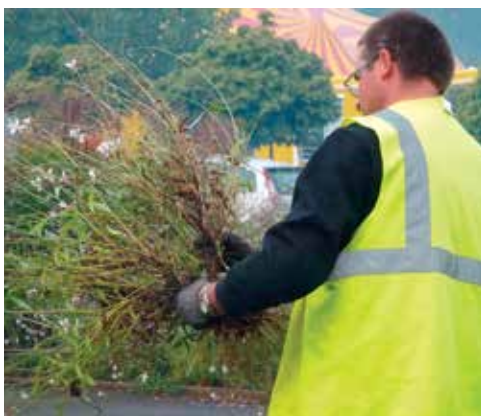
Agir ensemble pour un cadre de vie agréable