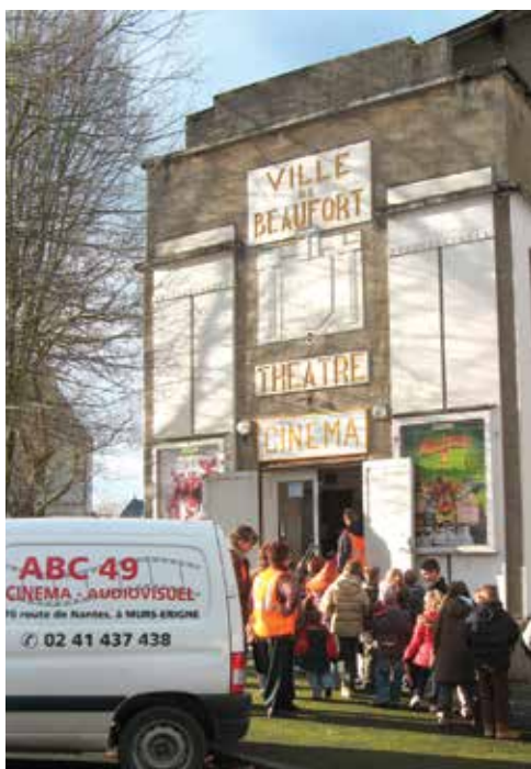
L'association ABC49 fournit les films projetés au cinéma-théâtre.

4 000 spectateurs ont vu un film au cinéma de Beaufort en 2011-2012