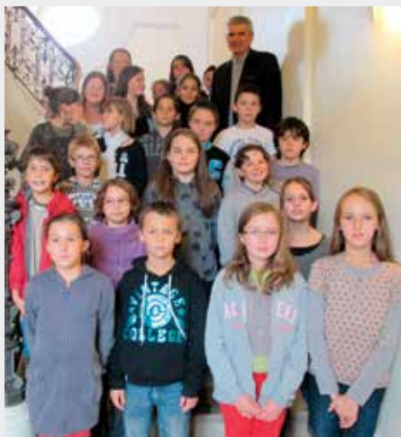
Le nouveau conseil municipal des jeunes