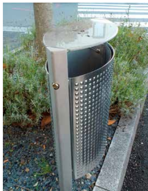
70 corbeilles sont vidées deux fois par semaines