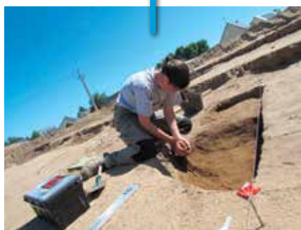
Nombreuses fouilles archéologiques