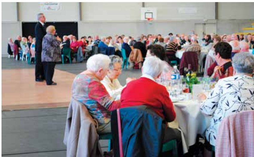
La Ville veille sur ses aînés

Le CLIC Loire Authion organise pour ses 10 ans le 25 septembre une journée d'informations et des ateliers pratiques avec de nombreux partenaires.