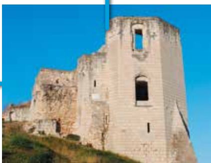
La tour octogonale du château fort