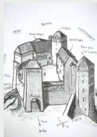
Une esquisse du château par Jean-Marie Schio

Jean-Marie Schio a découvert aux Archives nationales un document décrivant pièce par pièce le château en 1601 ! Une sorte d'état des lieux précis avec la description des 30 pièces, alors que le seul document connu datait du XIV ème siècle.