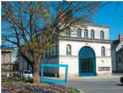
Des Halles construites en 1840