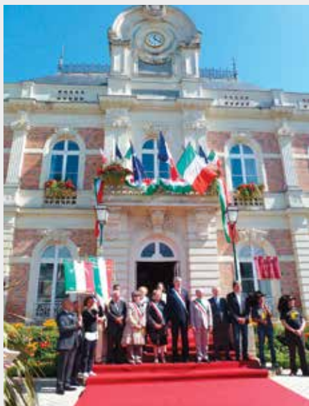
14 juillet 2012 : anniversaire du jumelage