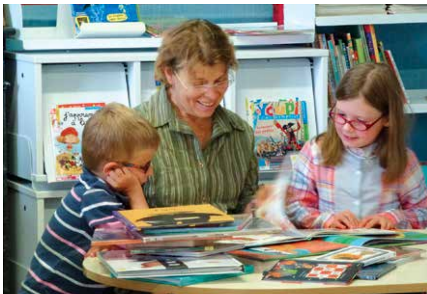
Les bibliothèques sont devenues des lieux de vie de proximité

La Ville aura en 2014 une bibliothèque Place de la République. Un projet novateur, adapté au besoin des Beaufortais.