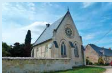
Le Prieuré d'Avrillé ouvert à la visite

Musée : visite libre des collections permanentes tout le week-end et de l'exposition « Les Arpenteurs » 11h-13h et 14h30-18h.