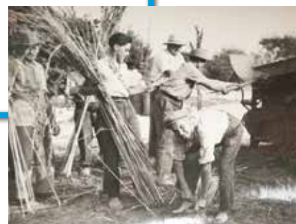
La récolte du chanvre