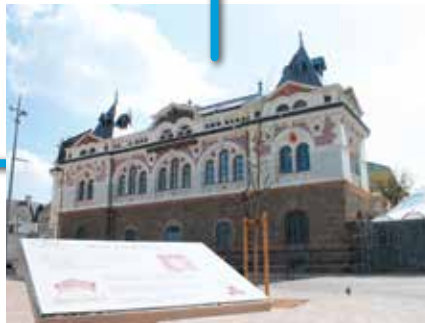
Le musée Joseph Denais restauré en 2011